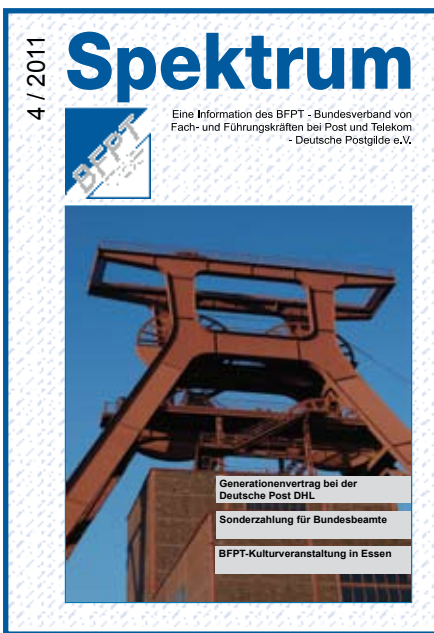
Titelbild: Zeche Zollverein in Essen